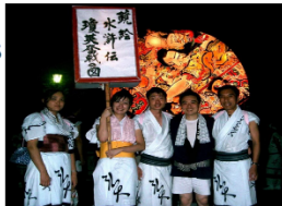
弘前城(桜)・ねふた(弘前大出陣)